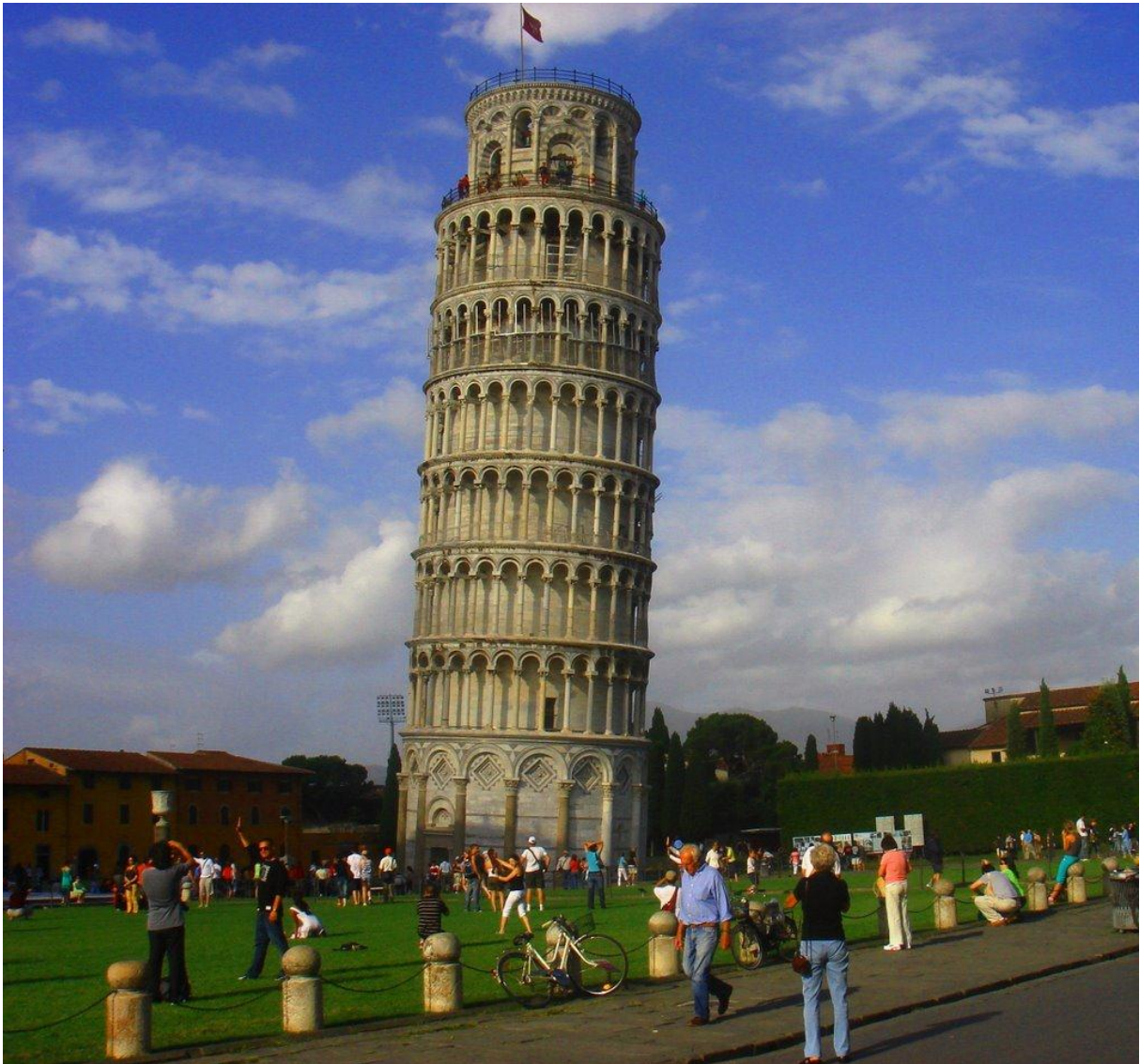
3. ábra Pisai ferdetorony

Egyes esetekben ezeket a súlypontokat a média által egyértelműen definiáltak, gyakorlatilag mindenki számára 1-2 nézőpontban létező helyek, építmények (3. ábra).