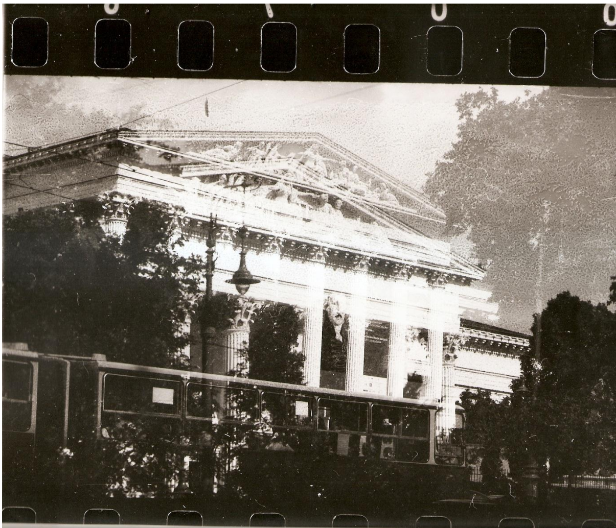
16. ábra (saját fotó)