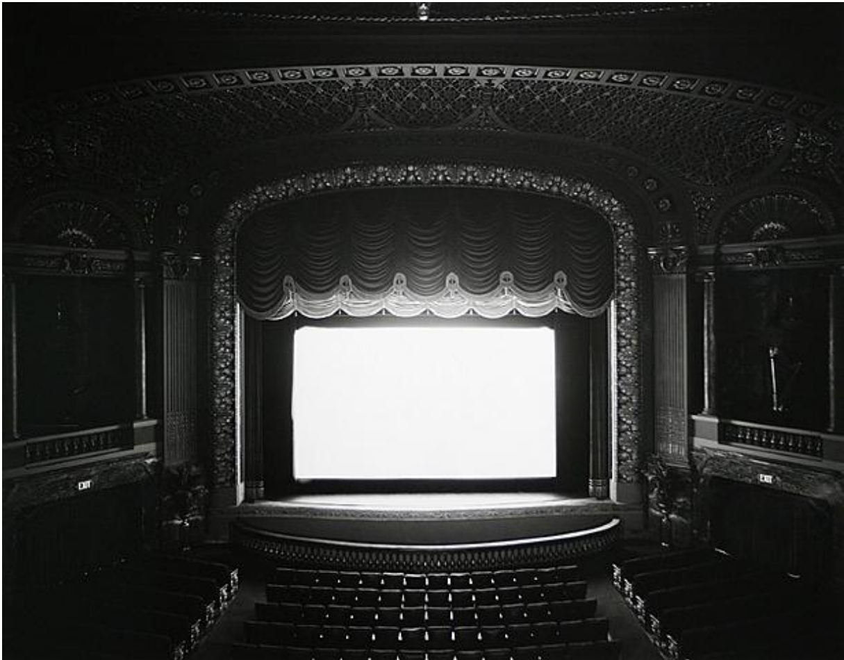
5. ábra (Hiroshi Sugimoto: Byrd, Richmond , 1993 )

Másik projektje során, filmszínházakban egy film levetítése közben készít egy a film hosszával megegyező expozíciójú képet, így gyakorlatilag a teljes videót egy kockában sűríti (4. ábra).