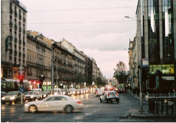
10. ábra Kísérleti tekercs A felvétel (saját kép)