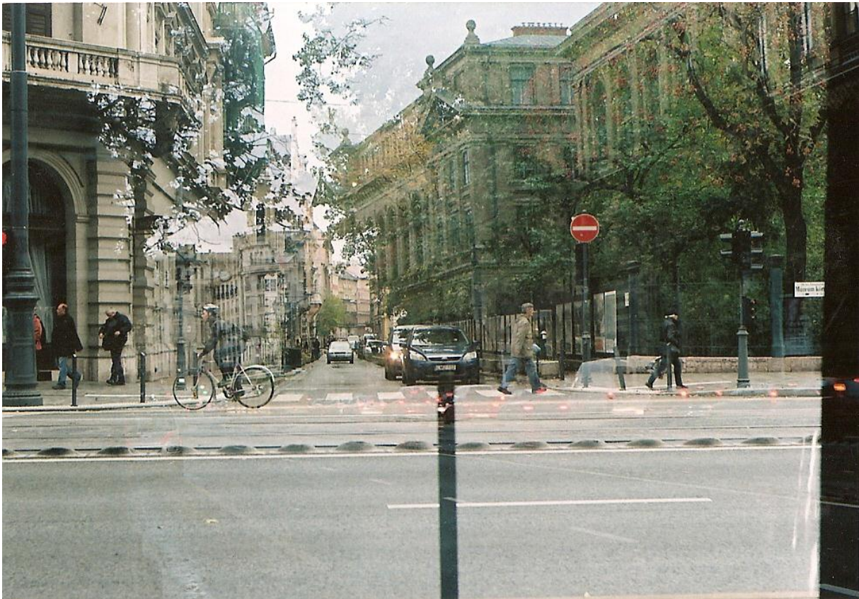
12. ábra Kísérleti tekercs A+B felvétel