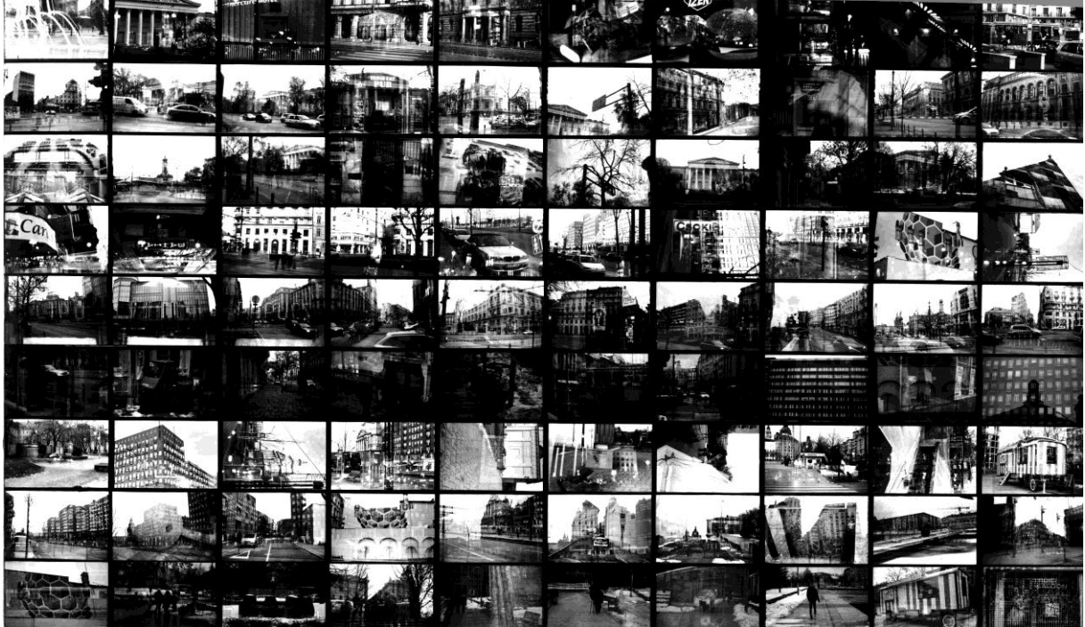
1. ábra Bevezetés a környezetesztétikába: Kálvin tér- Deák Ferenc tér bemutató tabló (saját kép)

E feladat elkészítésekor szintén alkalmazott gondolati és technikai folyamatot folytattam.