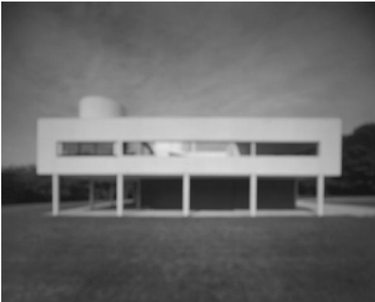
4. ábra (Hiroshi Sugimoto: Villa Savoye forrás: http://www.artnet.com )

Egyik ilyen projektje, mely során híres épületeket, ismert szögekből fotóz, úgy hogy azok életlenek, így gyakorlatilag lecsupaszítja az építészeti alkotást, a részletek elmosásával előtérbe hozza a fő karakterét (4. ábra).