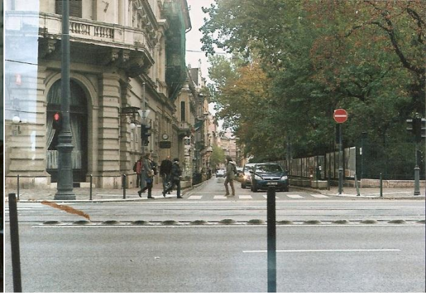
11. ábra Kísérleti tekercs B felvétel