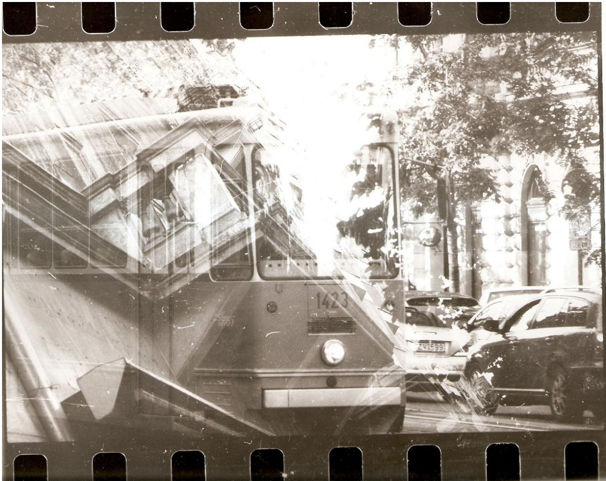
13. ábra

Az alkotás során véletlen és az analóg technika által egy-egy képen létre hozott vizuális illetve tartalmi értékek kerülnek bemutatásra a létrejött nagymennyiségű nyersnyersanyagból (~150 kocka) leválogatásra és kiállított sorozattal. Az elkészült képek hagyományos fekete-fehér technikával, kézzel előhívva, nagyítva készültek. (Az elkészült képekből kiválogatott illusztrációk 13.-16. ábra).