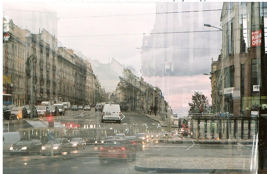
9. ábra Kísérleti tekercs A+B felvétel