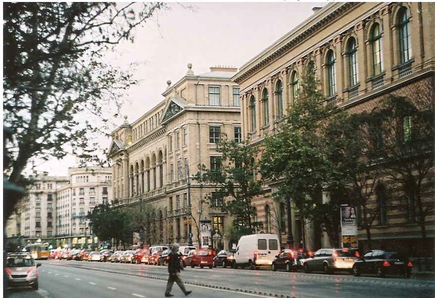
8. ábra Kísérleti tekercs B felvétel