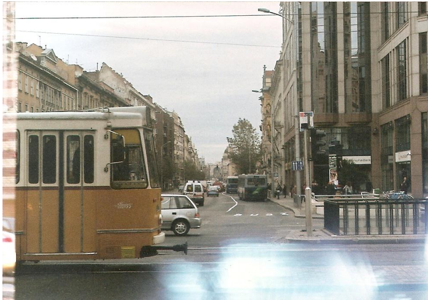
7. ábra Kísérleti tekercs A felvétel

Így egy-egy sorozat készítésekor az alábbi metódust követtem: Egy ember végig sétál egy analóg fényképező géppel az adott, útvonalon, és pár szabályt betartva elkészít 30 db felvételt (a multi expozíció miatt -1/3 F s -vel alul exponálva), majd ugyan ezt a tekercsot visszafűzve egy másik ember is végig megy ugyan azon az úton, ugyanazon szabályok szerint fotózva.