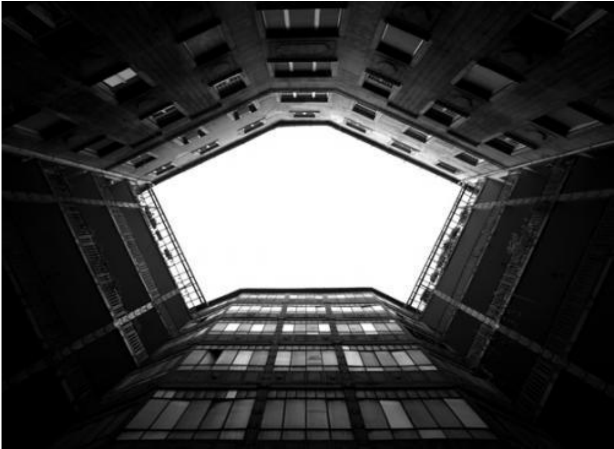
6. ábra (Czigány Ákos: Egek c. sorozatból)

Ezekre a képekre reagál Czigány Ákos: Egek címet viselő sorozata.