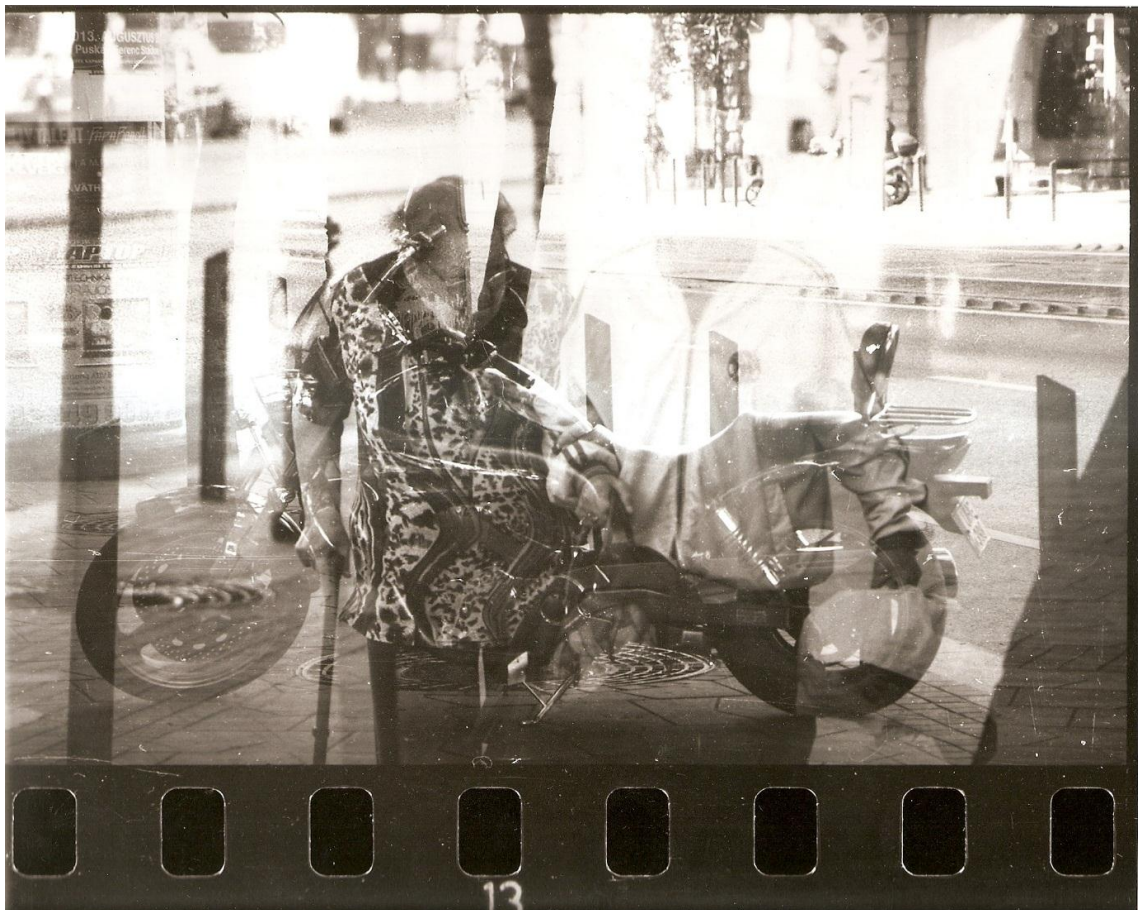
15. ábra