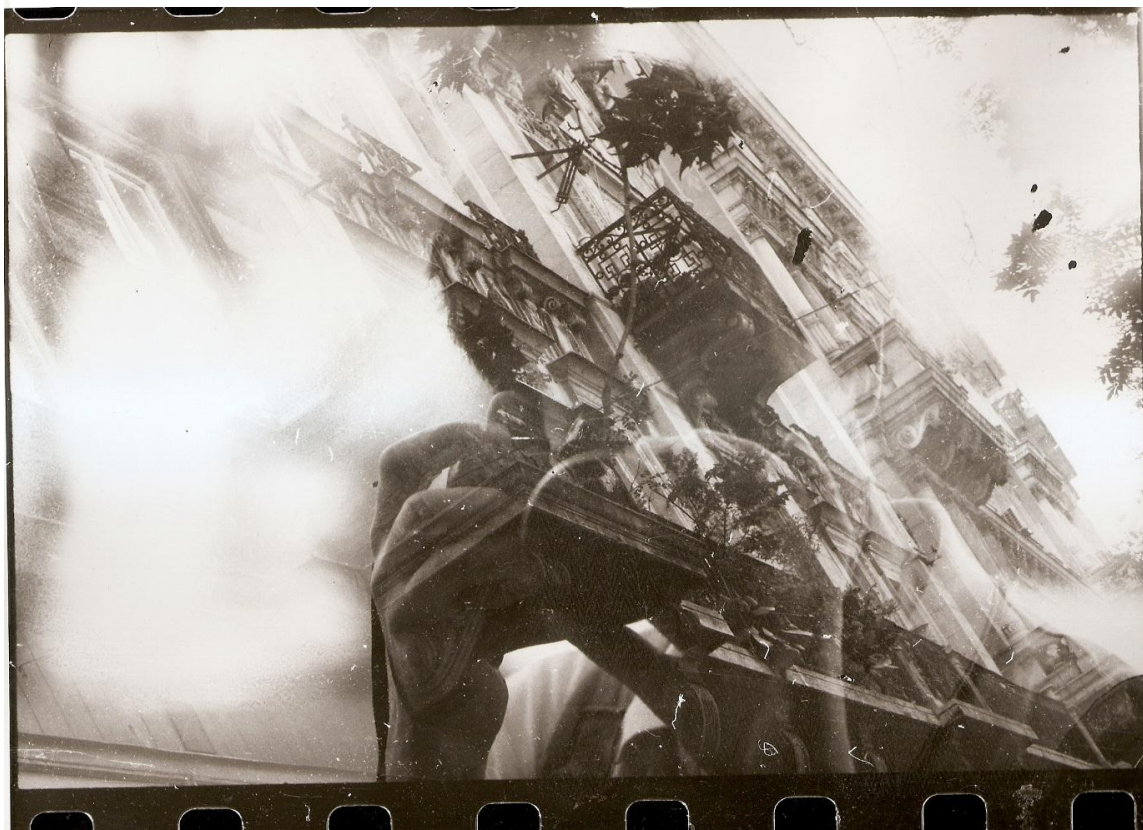
14. ábra