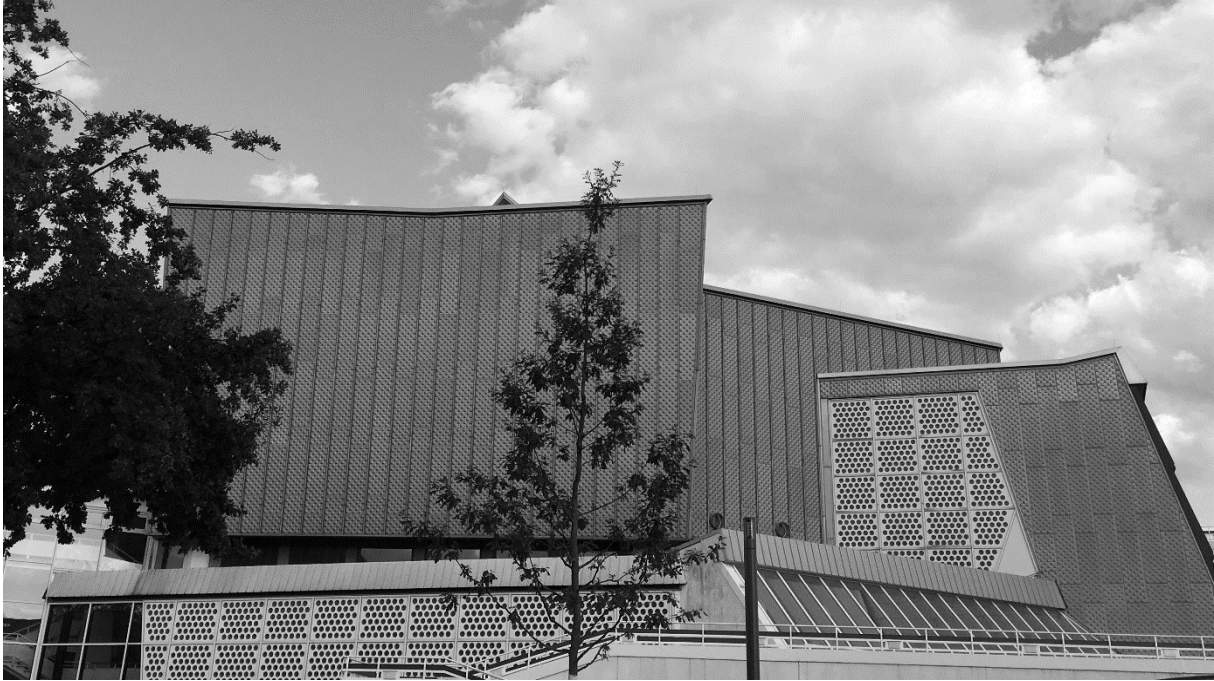
3. ábra: Hans Scharoun, Philharmonie, Berlin, Fotó: Varga Lilla Luca

helyszínre építsen. Úgy döntött, hogy egy múzeumot hoz létre. 6 A kerületet, amely már az első világháború ideje alatt is több sérülést elszenvedett, a második világháború alatt a földdel tették egyenlővé 7 , így Mies is részese lehetett a romokban heverő városrész helyreállításának.