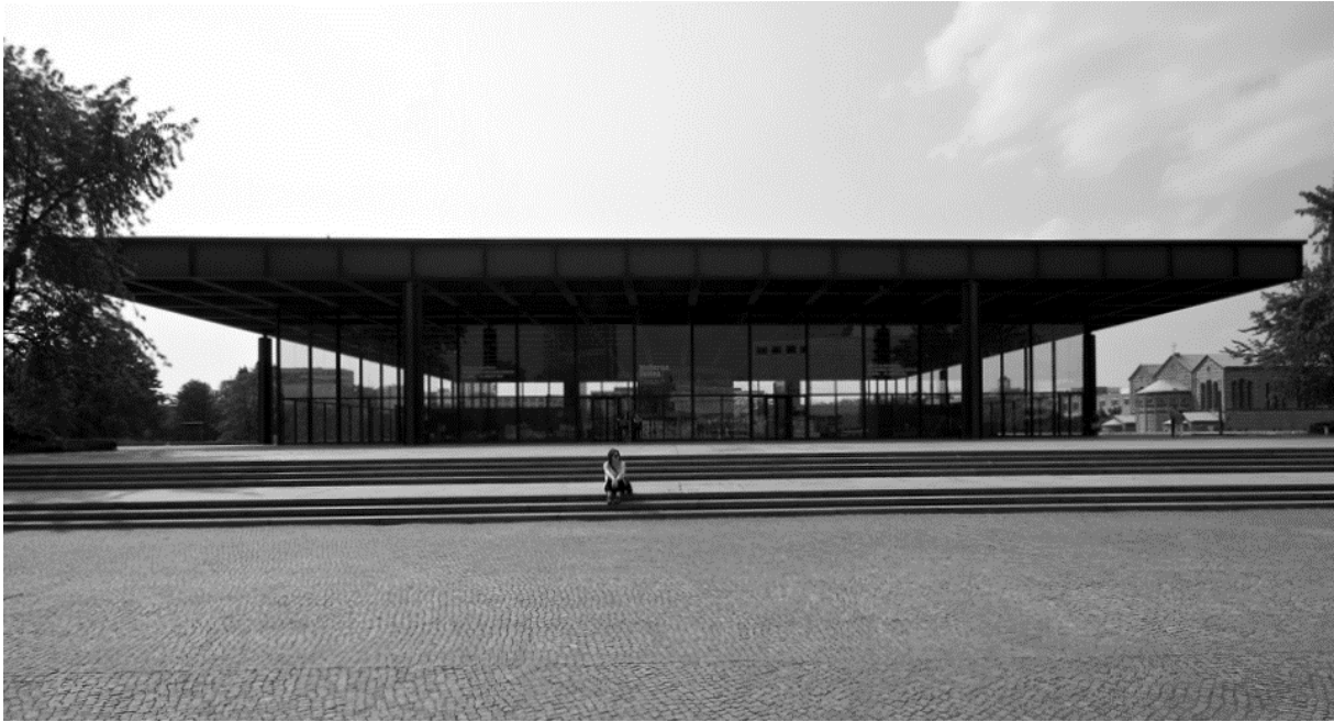
12. ábra: Neue Nationalgalerie

Vélhetően megengedhette volna magának, hogy személyes stílusának nyomát az épületen hagyja, vagy saját belátása szerint alakítsa azt át, a múzeum ugyanis a mai esztétikai elvárásoknak sem tökéletesen felel meg, mivel elég határozottan a hatvanas évek aktuális „divatját” követi a belső megjelenése. De a felújítás egyértelműen megtagadja a múzeum átalakítását a kortárs eszmék és esztétikai értékek szerint, így tartózkodik a vizuális látvány “felfrissítésétől” is. Ezek helyett sokkal inkább egy óvatos manőverezés volt a műemléki értékek és morális kérdések között, amelyek a tervezési és felújítási folyamatot is irányították