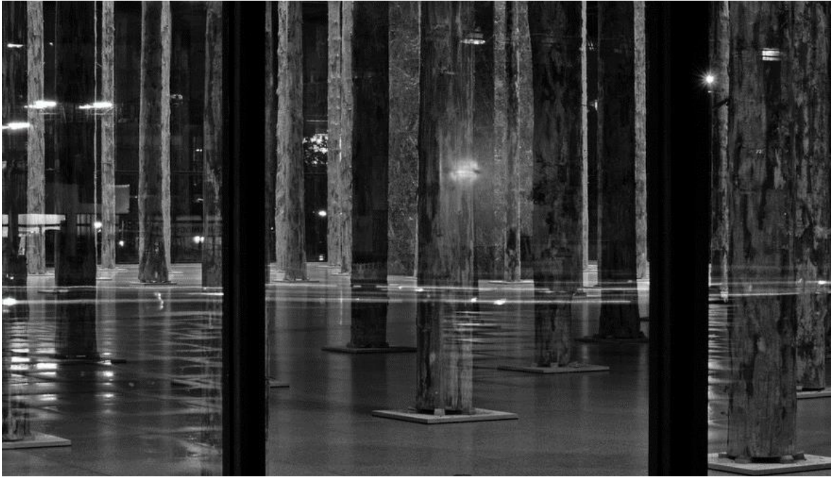
7. ábra: David Chipperfield - Sticks and Stones, Berlin

A térbe helyezett lebegő fa „pillérek” és az épület padlólemeze együtt idézik vissza a történeti építészetből jól ismert súlyos építészeti elemeket, és a tektonikusságot, ezzel szemben az üvegburok felett lebegő tető és a letisztult szabad tér a modern építészet könnyedségét képviseli. Chipperfield szerint az oszlopok alkalmazása a Mies által létrehozott tökéletesen üres, pillérek nélküli térben izgalmas és ironikus is egyben.