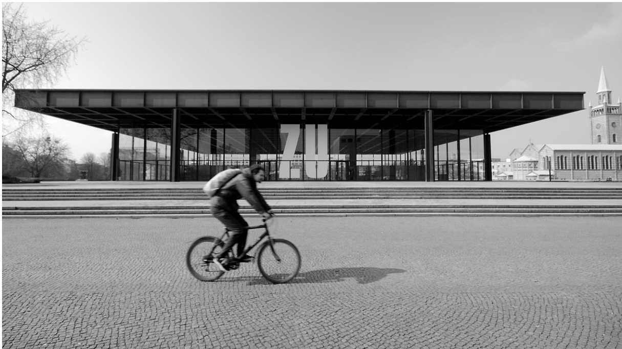
1. ábra: Neue Nationalgalerie, Berlin, Fotó: Phil Shirley/Flickr

Berlinben a Kulturforumon található a Neue Nationalgalerie, amely megnyitása óta folyamatosan nagy látogatottságnak és elismerésnek örvend. 1968-ban épült, az akkori Nyugat-Berlin területén. Tervezője Mies van der Rohe, a modern építészet egyik ikonikus alakja volt. A múzeum a huszadik század egyik legismertebb építészeti alkotása, mely egyben a modern építészet és művészet temploma. A Neue Nationalgalerie az egyetlen megbízás volt, amelyet Mies van der Rohe a német államtól kapott és valóban meg is épült, valamint az egyetlen általa tervezett második világháború utáni épület Németországban. Az Új Nemzeti Galéria feltehetőleg sokkal többet hordoz magában Miesből, mint bármely más általa tervezett épület. Egy művészeti múzeum komoly épületszerkezeti és építészeti elvárásoknak köteles megfelelni, példánk viszont a korabeli épületfizikai tervezés, jelenben elégtelen körülményeitől szenved. 1 Ezek a követelmények idézték elő a szükséges felújításokat, amelyek tervezését 2015-től kezdődően David Chipperfield, korunk egyik kiemelkedő építésze és irodája végezne.