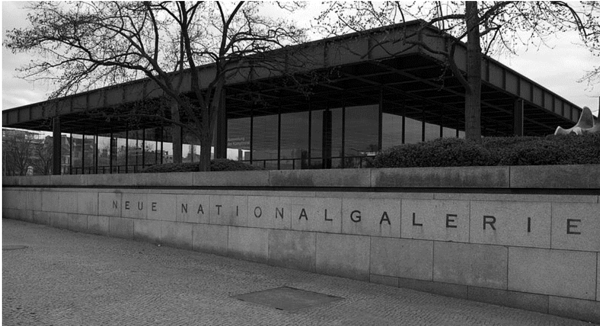
11. ábra: Neue Nationalgalerie

elképzelés részét képezik. Semmi sincs elrejtve, minden pontosan az, mint aminek látszik, egy tökéletes egység, egy gondolatot szolgálva. 39