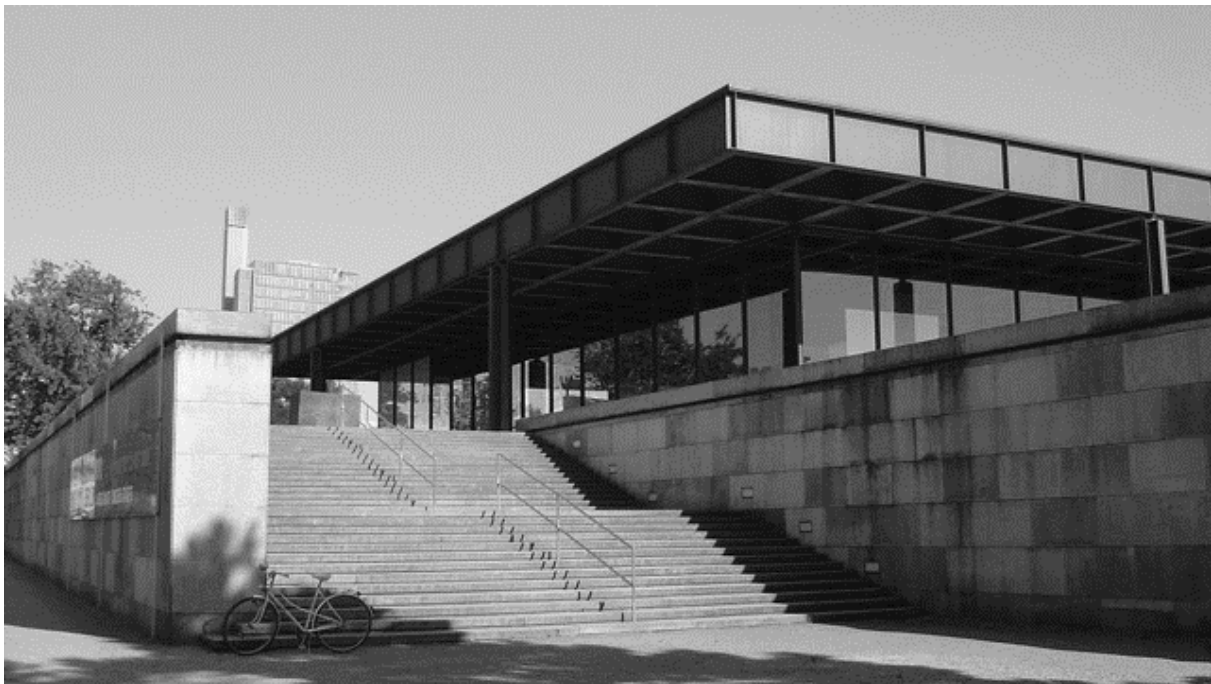
4. ábra: Neue Nationalgalerie, Berlin, látkép a Tiergarten felől

A múzeum-funkció kiszolgálása érdekében szükség volt egy nagyobb teremre az időszakos kiállítások, és kisebb termekre az állandó kiállítás számára, illetve irodákra, raktárra, műhelyekre és egy kertre a szobrok elhelyezéséhez. Az épületre fém tető került, amely az 54 méter hosszú üveg függönyfalakkal határolt területet fedi le. A hatalmas teremben válaszfalakkal határolt kiszolgálóhelyiségek találhatók. Lépcsők vezetnek le az alsó szintre, ahol egy négyzetes kiállítóterembe juthatunk, amely az állandó kiállítás tereként szolgál. Innen nyílik a szoborkert is, valamint a másodlagos helyiségekbe is innen biztosított a bejutás. Ennek a további szintnek a beépítésével növelte Mies a hasznos alapterületet, így itt elfértek a kiszolgálóhelyiségek is, valamint közvetlen kapcsolat jött létre a külső és belső terek között.