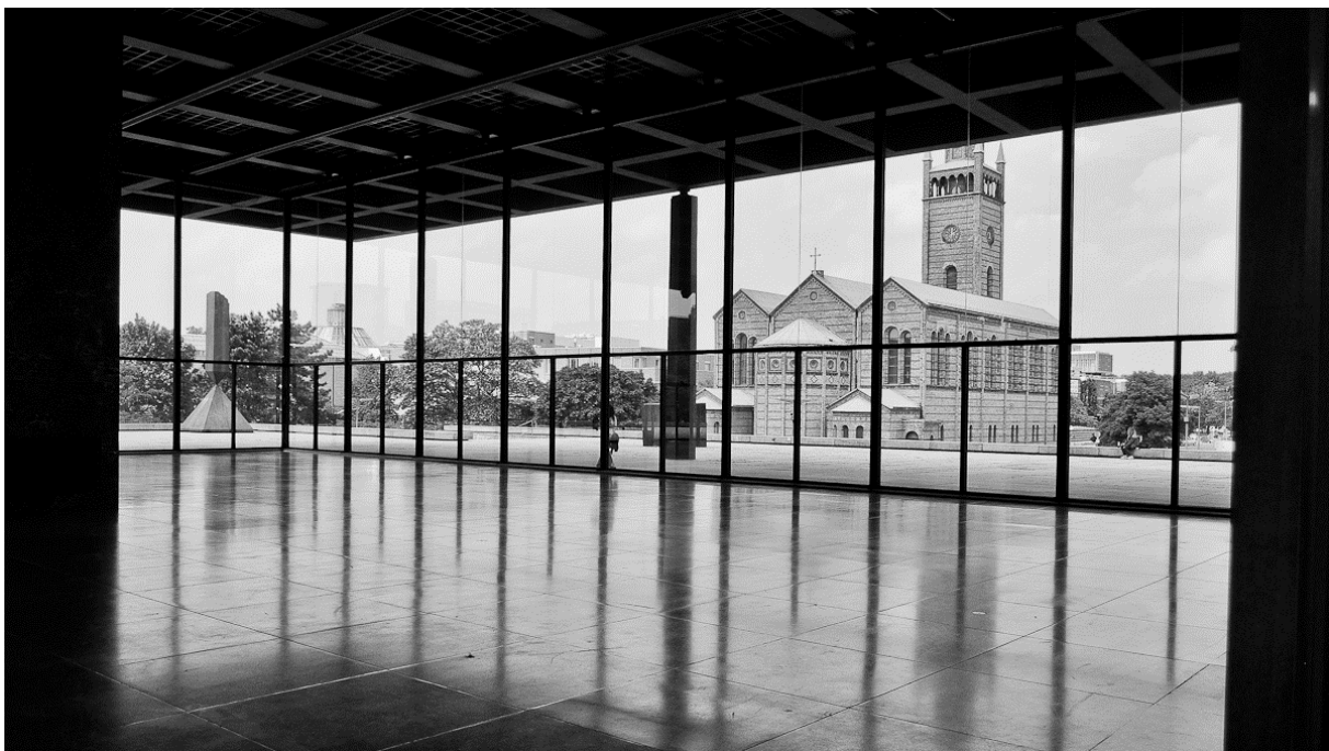
10. ábra: Neue Nationalgalerie

A felújítás komoly akadályokat szab, de megpróbálnak egyensúlyt tartani a régi megőrzése és a nyomás között, hogy minden mai elvárásnak megfeleljen a múzeum. „Olyanok vagyunk, mint a sebészek a test körül. Felnyitottuk és most mindannyian ránézünk.” 35 Így, miután a tíz építészből álló csapat - akik a szétbontáson dolgoztak - közel fél év munka után végzett, 35 000 épületdarab várt tisztításra és katalogizálásra. Ezek között 14 000 gránit lap, 3 500 világítás rögzítő elem, és még egy Mies által tervezett hamutál is volt. 36