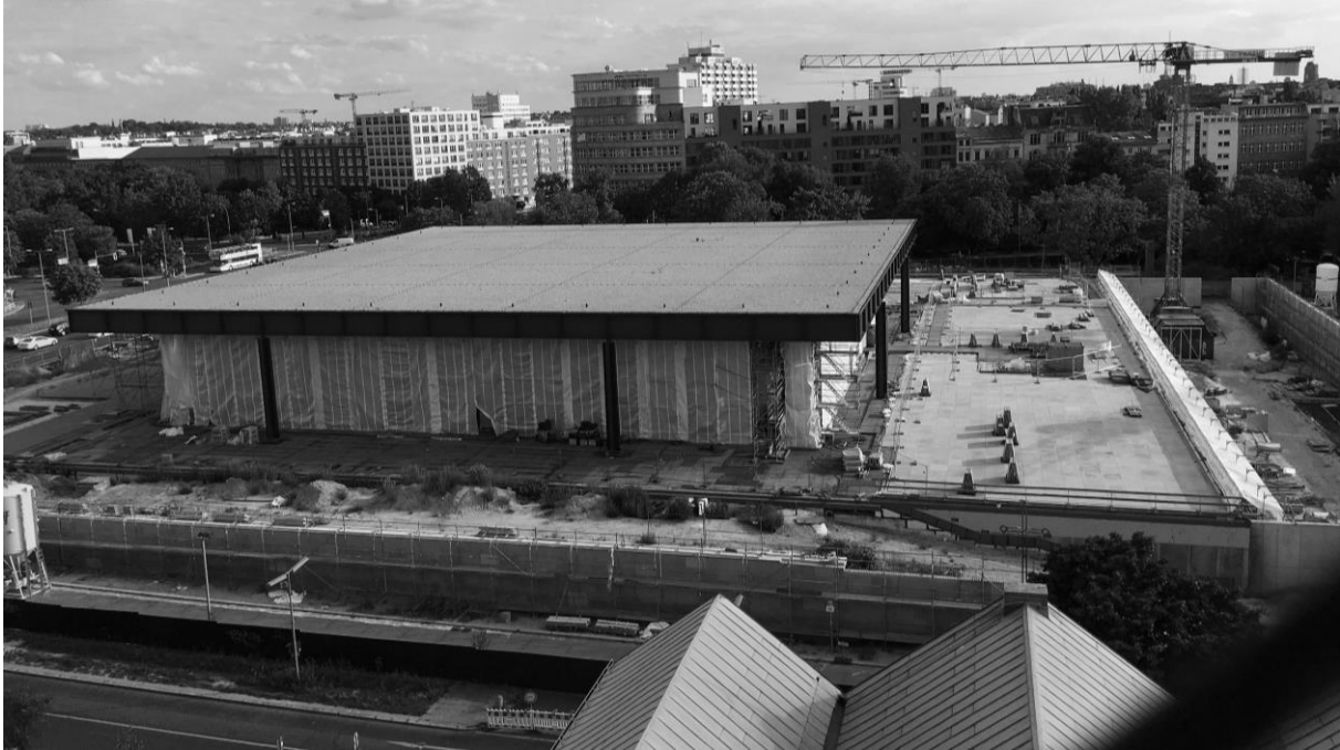
8. ábra: A Neue Nationalgalerie a St. Matthäus Kirche-ből

Ezután 2015 januárjában a múzeum bezárt, és megkezdődött a kipakolása. A gyűjtemény kiállított, és a raktárban tárolt darabjait is külső helyszínekre szállították. A Hamburger Bahnhofban kaptak helyet jövőbeli katalogizálásukig, valamint ide kerültek az adminisztratív helyiségek is. A nagy méretű szobrokat is elszállították a kertből. A ki- és átköltöztetés több mint egy évet vett igénybe. 28