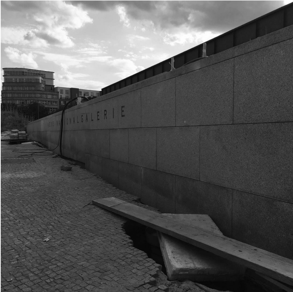
2. ábra: Neue Nationalgalerie felújítás alatt

kapott a 60-as évek elején, így hetvenhat éves korában visszatért a városba, ahol pályafutása elindult és hírnevet szerzett, hogy megkezdhesse nagy, berlini projektjét. 5