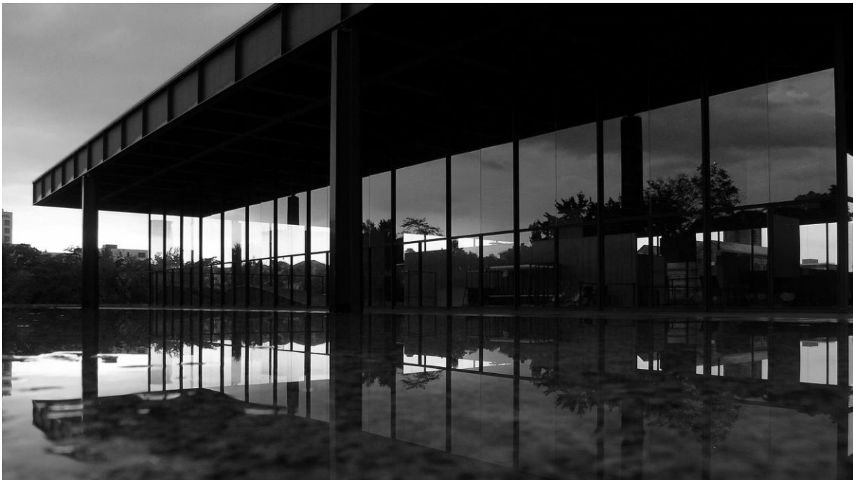
6. ábra: Mies van der Rohe Neue Nationalgalerie

belül 19 . Annak ellenére, hogy sok teljesen új épületet tervezett, azon projektjei által vált egyedivé és emiatt ismertté, melyeknél az újat a régivel ötvözi, a jelent a múlttal összeköti. A Neues Museum mellett számos más épületénél felfedezhető ez a motívum, bátran ötvözi az új épületrészeket a már meglévővel, ezzel különös hatást elérve. Ilyen jellegzetes épület például a berlini Galerie am Kupfergraben, egy második világháborúban lebombázott épület, amelyen évtizedekig egy hatalmas lyuk tátongott. Az új kortárs épületrész ezt a sérülést tölti ki, emlékeztetve a múltra, anélkül, hogy másolná vagy a helyébe próbálna lépni. A legfőbb alapelve az, hogy minden épület egyedi és ennek következtében a felmerülő problémák is egyéniek. Az iroda filozófiája az, hogy „pontosan megértsük, hogy az épület mi volt, és milyen volt. Majd ezután megfontolható lépésről-lépésre, hogy mit szeretnénk tenni vele.” 20