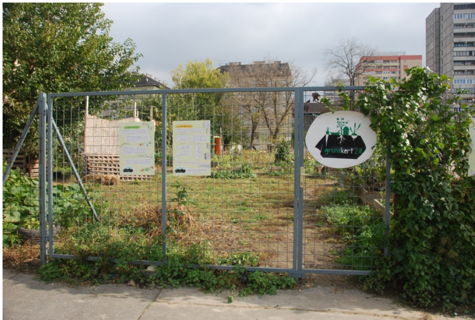
6. kép: A Grund kert 2.0

kicserélődött, illetve 2013 őszén kiderült, hogy még a tél előtt ki kell költözniük a telekről, mert ott folytatják a nagy léptékű Corvin sétány projektet. Ennek ellenére nem ért véget a Grundkert, mivel a Futureal egy másik telket ajánlott fel a közösség számára, amelyen előreláthatólag a következő öt évben fennmaradhat a közösségi kert (6. kép). A felmerülő pénzügyi költségeket pedig a Fővárosi Önkormányzat által kiírt zöldfelületeket támogató pályázatból tudták fedezni a Grundkertesek.