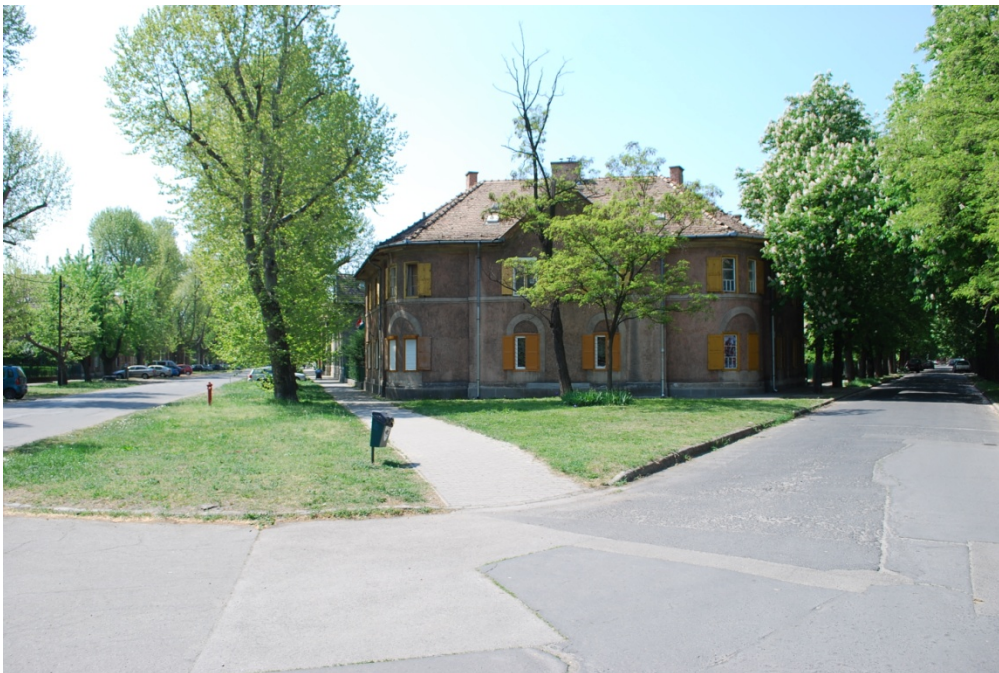
3. kép: Wekerle-telep, a Howard-i álmok megvalósítása Budapesten

Erre a leghíresebb példa az 1908-tól az akkori főváros peremén, Kispesten kiépített, a Howard-féle kertvárosi mintát követő Wekerle-telep. A telepet azzal a céllal hozták létre, hogy a főváros kezében lévő vállalatoknál dolgozó munkások megfizethető, élhetőbb helyen tudjanak lakni, szemben a belső városrészekben uralkodó zsúfolt, egészségtelen körülményekkel. A tervezés során központi elem volt a telep kertvárosi jellege. Az utcák rangját tudatosan hangsúlyozták a zöldterületek kialakításával és a növényültetéssel (3. kép).