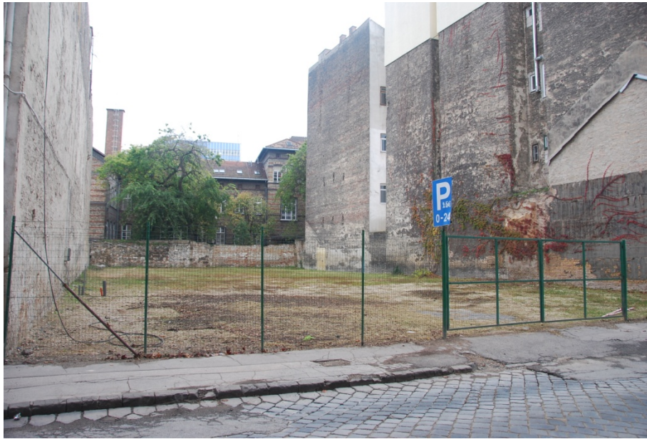
2. kép: Parkolási célú ideiglenes hasznosítás Budapesten

autósok rendelkezésére. Ez a fejlesztés akár a fentebb említett belvárosi parkolóhelyekre való igényt is csökkenti, így az ideiglenes használatra más alternatívát választanának az ingatlantulajdonosok (pl. közösségi kulturális színtér, zöldfelület, közösségi kert stb.).