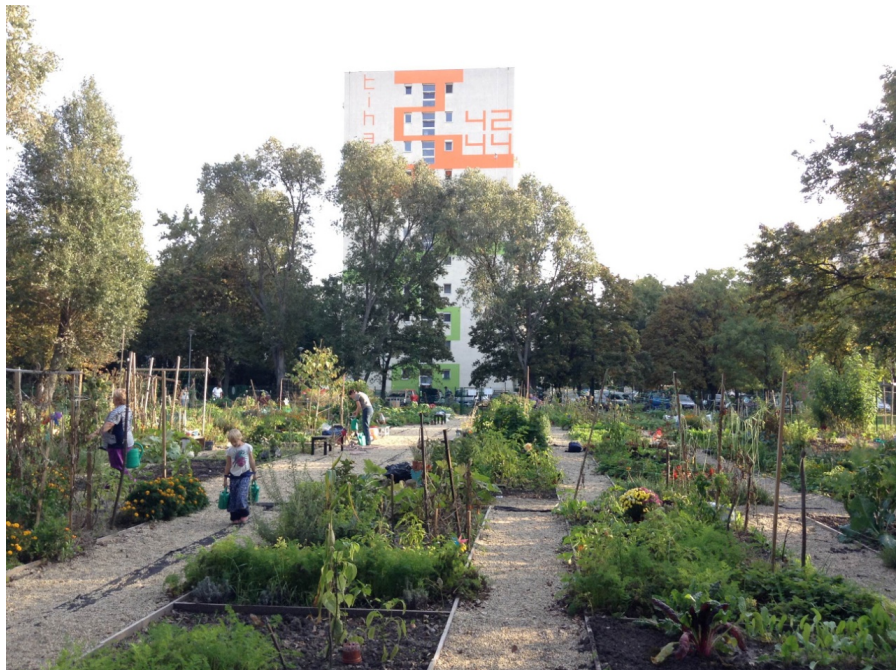
5. kép: ZUGkert Budapesten

A külvárosi közösségi kertek közül utolsóként vizsgált ZUGkert helyi civil kezdeményezés eredményeként született meg 2014 tavaszán (5. kép). Az ötlet a belvárosi Grund kert példájából adódott, még 2012 őszén. A kert tényleges megvalósulásáig tartó folyamat viszonylag akadálymentes volt, azonban így is sokáig, közel két évig tartott. Az önkormányzat a kezdeményezőket megkeresésére telket adott, sőt elvégezte a területrendezést, kivitelezést is. További kapcsolatoknak köszönhetően a kert az Európai Unió Hortis projektbe is bekerült, mint referenciakert. Az utóbbi program kertészeti tanfolyamok, és „zöld” programok szervezésével igyekszik ösztönözni a városi kertművelést. A kert ötletét már az első nyilvános fórumon, 2012 tavaszán, pozitívan fogadták, nagy volt az érdeklődés a helyiek részéről és később a várakozással töltött időszakban is további szabadtéri programokat szerveztek a területen.