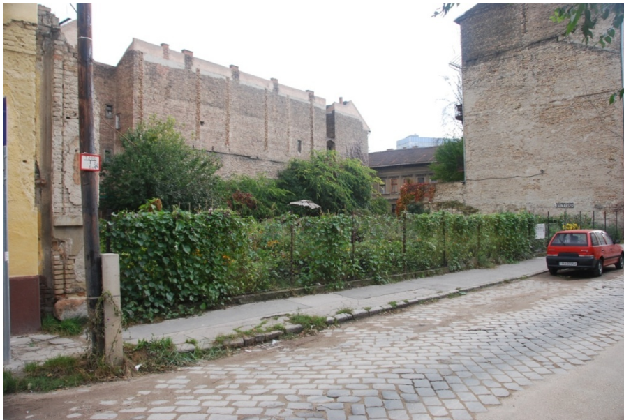
5. kép: A Leonardo Kert a VIII. kerületben

második évre csupán 3, a harmadik évre 14 parcellának lett új gazdája, ám idén a túljelentkezés a megüresedett telekrészekre már 14-szeres volt. Legtöbbször a környékről való elköltözés indokolta a kerttagok cseréjét. A közösség korosztálya szintén vegyes, legtöbbször a fiatal felnőttek, gyerekes családok vannak. Összesen 95 darab, minimum 7 m 2 nagyságú parcellát alakítottak ki, melyekből öt tanparcellaként működik, kihelyezett környezetismereti óráknak, pedagógus tréningnek, külföldi csoportok látogatásának szolgál bemutató helyként (5. kép).