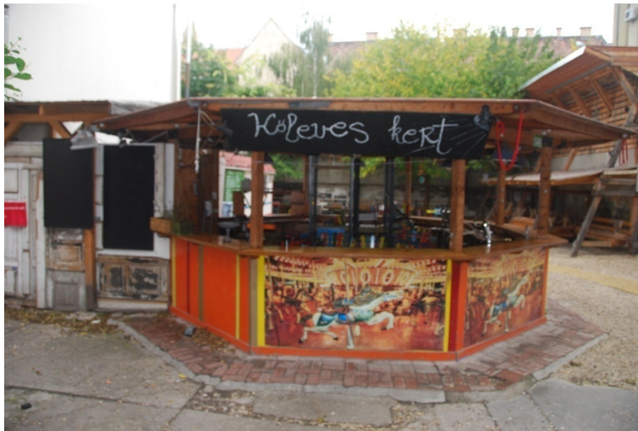
1. kép: A vendéglátási célú ideiglenes hasznosítás példája Budapesten

Talán elsőként említhető az ezredforduló óta egyre nagyobb számban fellelhető 'romkocsmák' csoportja. A kezdeményezés résztvevői a rossz állapotban levő épületek földszinti, illetve emeleti helyiségeit egybenyitják, ezekhez gyakran a régi épületekben meglévő belső udvar is kapcsolódik, mint központi szervező elem. Vannak olyan romkocsmák, melyek korábban parkolóként hasznosított foghíjtelkeken találhatóak (1. kép). Közös jellemzőjük tehát a helyszínen szolgáltató funkcióvesztett, elhagyatott vagy kihasználatlan ingatlan (pl. a Kuplung egy volt autószerelő műhely helyén üzemel), illetve a tetszőlegesen összeválogatott, láthatóan régi elemekből álló bútorozás, mely a romosság érzetét kelti.