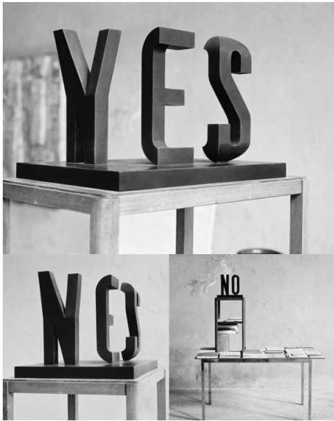
/Markus Raetz, Yes or No sculpture/

Markus Raetz Yes or No alkotásában szintén ellentétes jelentések léteznek egyszerre. Ebben az alkotásban maga a gondolat inspirált, hogy a két ellentétes jelentés egy rendszeren belül nemcsak megférhet, hanem szerves részei is lehetnek egymásnak.