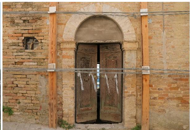
Kép 2;3;4;5: Falerone látkép, utcaképek és részlet – fotók: Herpai Márk, 2018.