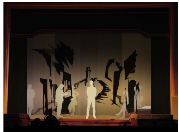
Kép 7; 8; 9; 10: Részletek a színpadtervhez készült animációból