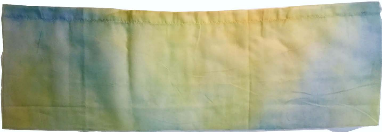
Kép 6.: A színház makettjéhez készült függöny színtanulmánya – fotó: Pokol Júlia, 2018.

A háttér színe a helyi utcakép és a táj inspirációjából fakad: az ég kékje, és a téglaházak sárgás homlokzata jelenik meg az áttetsző függönyökön. Az alkotótábor során alkalmazott akvarelltechnika ihlette folyamatos átmenet vonul végig az egyes darabokon, a színek pedig az eredeti háttéren megjelenő fényhatásoknak megfelelően változnak: az egykor fénysávot ábrázoló részen világos, sárga, míg a sötétebb, árnyékosabb részeken kékes árnyalatot kap.