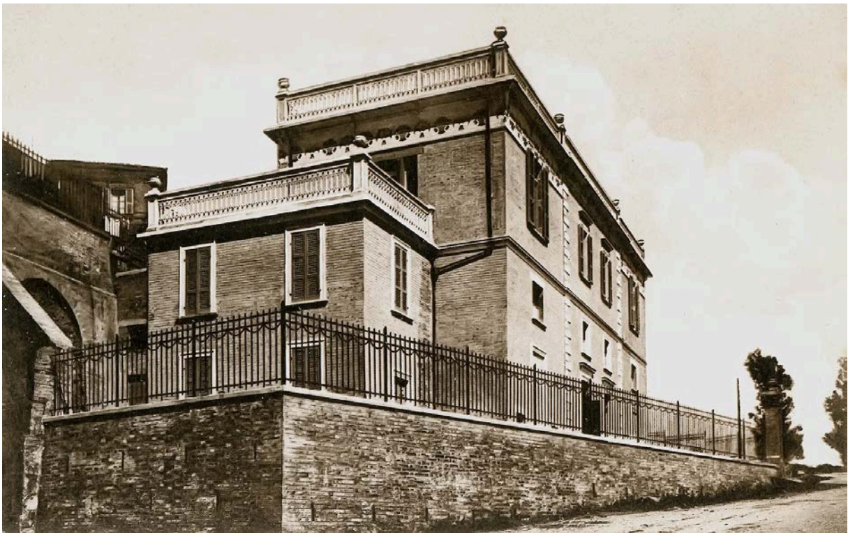
Kép: A Cine-Teatro Beato Pellegrino archív képe – fotó: Marco Armellini

Falerone történeti központjába beérve rögtön az egykori Cine-Teatro Beato Pellegrino épületébe botlunk. Az 1926-ban épült ház arra jött létre hajdanán, hogy a helyi ifjúság művészetét támogassa és szabad teret biztosítson kreativitásuk számára, fontos szerepe volt a helyi nevelésben, valamint a szabadidős szórakoztatásban is. Bár az elnevezés alapján színházra következtetnénk, működését tekintve inkább kulturális közösségi térnek nevezhető.