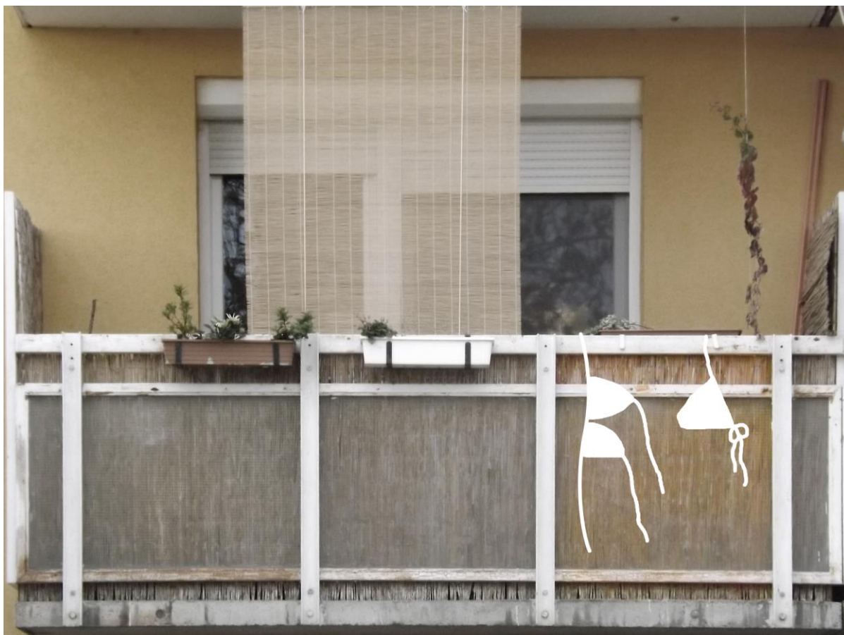
5673 - Nyári napsugár

Fények táncolnak a bambuszfüggöny résein átszűrődve. Piros bikinis lány lustán pihen. Perzselő forróság. Lent a téren sárga délibáb lengedez. Szeplős kéz jeges ital után nyúl. Az üvegen legördülő páracseppek hűvös illúziót keltenek. Kerek napszemüveg szűri a sugarakat. Szellő lebben, fények táncolnak. Barnulás. Olvadt naptej illat mindenütt. Méz-szőke haját borzolja a szél, aranyosan csillog a napfényben. Piros bikinis lány nyújtózik, álmosan fürdőzik az UV-ban.